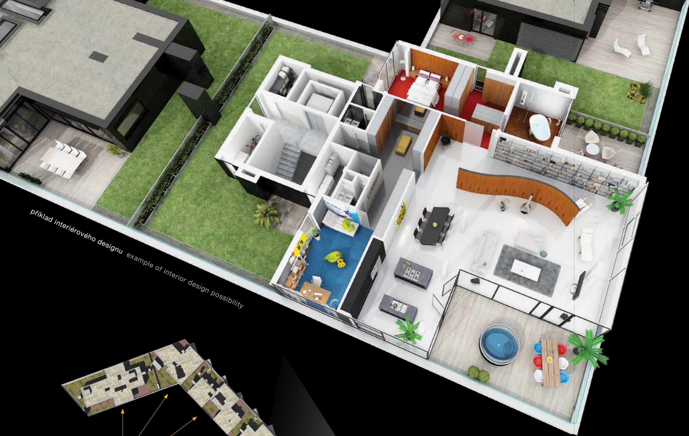
příklad interiérového designu example of interior design possibility