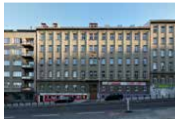
Veletřní Praha 7 2+1 | prodej