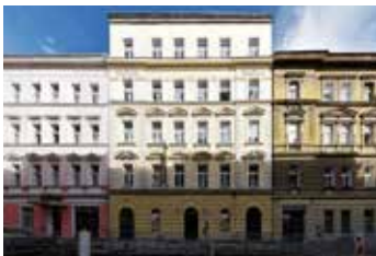
Bořivojova Praha 3 2+1 | prodej