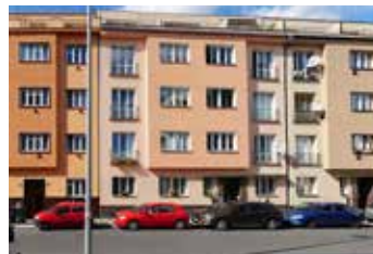
U Hranic Praha 10 2+kk | prodej