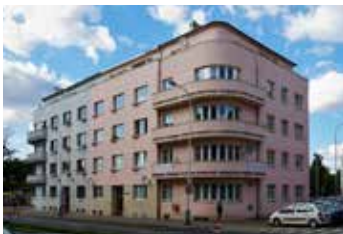
Dvorecké náměstí Praha 4 1+1 | prodej