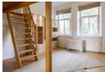
V Nových Vokovicích Praha 6 1+1 | pronájem