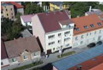
Ďáblická Praha 8 2+1 | prodej