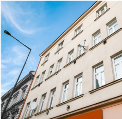
Bytový dům v ulici Nuselská nabízí tradiční městské bydlení v rezidenční části Prahy 4,

přibližně pět minut chůze od náměstí Bratří Synků. Z architektonického hlediska jde o klasický činžovní dům s historizujícími a raně moderními prvky, který je součástí městské blokové zástavby z přelomu 19. a 20. století. Tento typ zástavby vytváří živé městské prostředí s kombinací bydlení, obchodů a služeb.